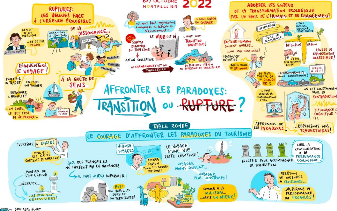
Illustration : Giulia David