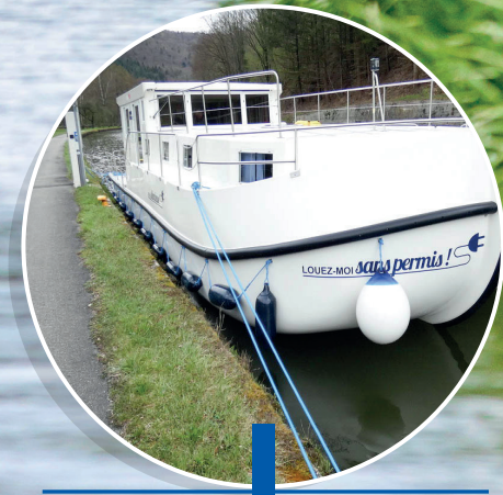
La Péniche S